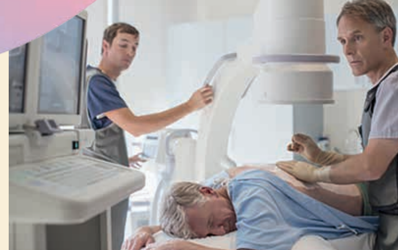
Eingriffe werden in Bauchlage durchgeführt

Chefarzt Neurochirurgie und Wirbelsäulen Chirurgie