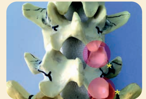
Facettengelenke (rot) mit den schmerzleitenden Nervenästen (schwarz) und Denervationspunkten (gelb)

Soll eine Thermodenervation durchgeführt werden, findet diese am Tag nach der Testbetäubung statt. Der Ablauf ist im Wesentlichen der Gleiche. Sie bekommen dabei einen neuen Schmerz-Dokumentationsbogen, den Sie bitte ebenfalls ausfüllen.